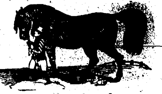
2 Cavallos furtados

PADEIRO Na padaria Santa Rosa em S. Rita precisa-se de um padeiro que saiba fazer pão, paga-se bem.